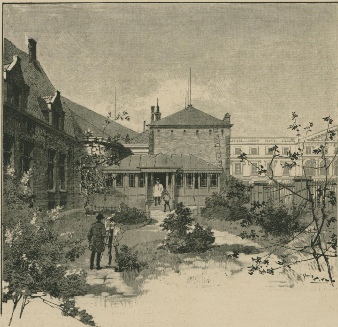
ENTRÉE DE LA BIBLIOTHÈQUE ROYALE EN 1857. Dessin de L. Titz, d'après les documents de l'époque.

s'élevaient jusqu'à 250,000 florins vis-à-vis de l'abbaye de Tongerlo et 150,000 vis-à-vis de l'abbaye de la Cambre, il fallut vendre les biens de la communauté. Sa suppression suivit bientôt ce douloureux sacrifice. Le gouvernement autrichien